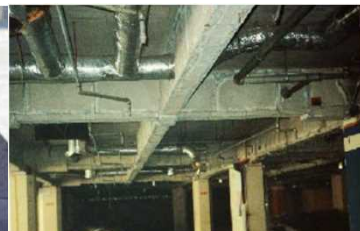
鉄骨を被覆して保護 石綿含有耐火被覆材