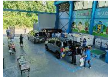
「エコニコ」: 金城産業