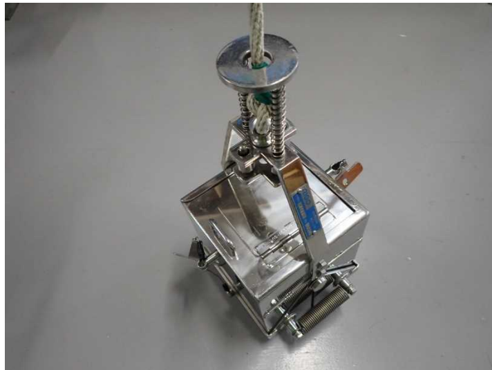
図.2 エクマンバージ型採泥器