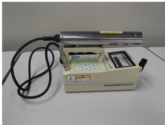
図.5 NaI（Tl）シンチレーション式サーベイメータ