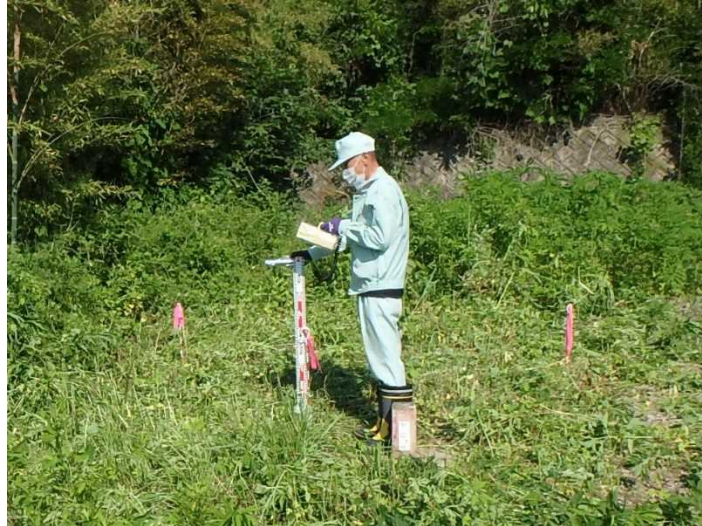
図.6 空間線量率の測定（例）