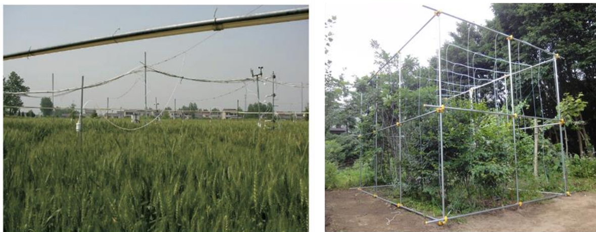
7 8 図 5 FACE 型のオゾン曝露システム. 左: 作物を対象としたシステム 9 (中国江蘇省) (Kobayashi, 2015). 右: 樹木を対象としたシステム 10 (北海道大学, 北海道札幌市) . 11

1 ューブから CO 2 を放出して、群落全体を覆う大気中の CO 2 濃度を均一に上昇させるとい 2 う施設である。この施設をオゾン曝露に応用し、世界各地において、作物や樹木に対する 3 FACE 型のオゾン曝露システムが構築、利用されており (Morgan et al. , 2004; Karnosky et 4 al. , 2007; Tang et al. , 2011)、日本においても樹木を対象とした FACE 型のオゾン曝露シ 5 ステムが稼働している (図 5) (Watanabe et al. , 2013; Kobayashi, 2015)。