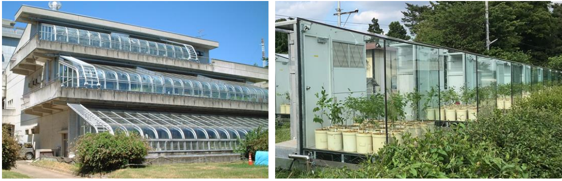
1 2 図 2 自然光型ファイトトロン. 左: 国立環境研究所 (茨城県つくば 3 市), 右: 東京農工大学 (東京都府中市). 4

5 人工光型グロースキャビネットは、温湿度に加えて光強度や日長が再現可能な反面、電 6 磁スペクトルが太陽光とは異なることや、植物と光源との距離の変化によって植物に届く 7 光強度が変化する(牛島, 1978)。そのため、人工光型グロースキャビネットを用いたオゾン 8 曝露実験で得られた結果を野外で生育する植物に対するオゾンの影響評価に直接適用する 9 ことは難しい。これに対して自然光型ファイトトロンは、ガラスによる紫外線の吸収がも 10 たらす光質の変化やフレーム等による光量の減衰があるものの、光条件は自然環境に近い 11 ため、本装置を用いたオゾン曝露実験により、植物の成長や光合成に対する長期影響とい 12 った個体レベルでのオゾンの影響を評価することができる。そして、ファイトトロン内の 13 オゾン濃度は制御可能であることから、自然光型ファイトトロンを複数台用意し、オゾン 14 濃度のみが異なる環境で植物を栽培し、その成長影響を調べることで、オゾンの積算曝露 15 量や積算吸収量に対する成長応答や収量応答を定量的に評価することができる。