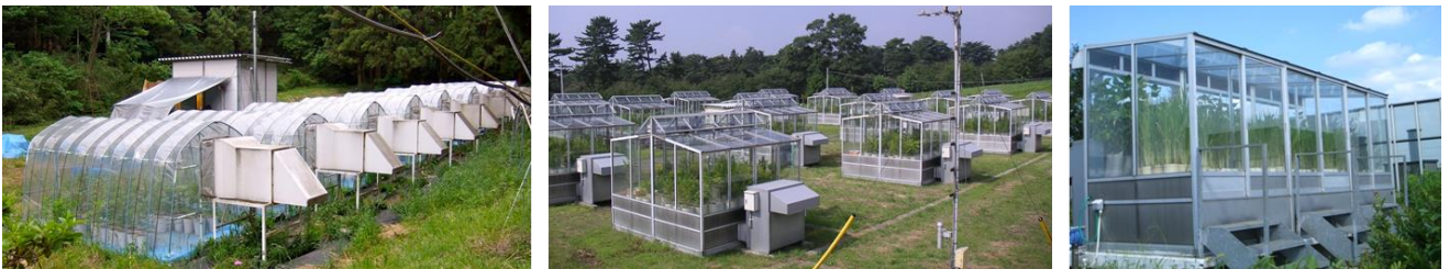
図 4 グリーンハウス型のフィールドチャンバー (東京農工大学, 東京都八王子市) (左) とガラス温室型のオープントップチャンバー (中央: 電力中央研究所, 群馬県前橋市; 右: 埼玉県環境科学国際センター, 埼玉県加須市)