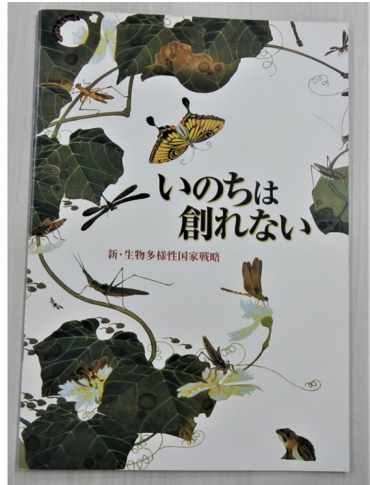
新・生物多様性国家戦略パンフレット

「いのちは創れない」のタイトルは、誰だったか。計画課の中で議論して、「いや、これは自然再生が目玉だから、創れないはバッティングしないかな」とかといろいろ悩みながら（決めた）。1つ思うのは、あれほど必死でやると、チームに勢いが出てくる。アルバイトの女性まで乗ってくる。だって、普通アルバイトが自腹切って古本屋で本買ってこない。