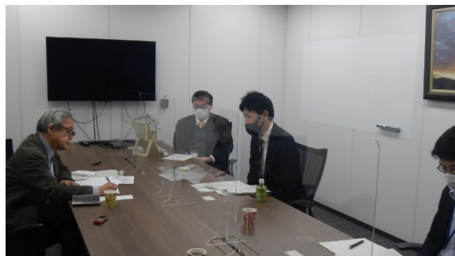
インタビュー風景

生物多様性条約の締約国になって、先進国としていい計画を作りなさいというのがある。それは応えなきゃいけない。そのためには、言わば国際的な自然保護機関なんか重視しているものをちゃんと守る。また、個別の保護政策としては、南西諸島がようやく保護の手当がなされるようになった。それは国際的約束。ようやく国立公園にして、世界遺産に今年なった。これ