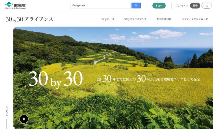
【Webサイトのイメージ】