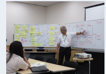
水銀マテリアルフロー作成に係る訪日研修の様子（2019年）

各国にとっての次のステップは、モニタリングデータや各種報告書等から有用な情報を得るため、ステークホルダーとの協議を進めることです。情報やデータの不足は途上国にとっての共通課題です。各国の状況に応じた適切な情報やデータの収集方法に関して日本が途上国を支援することは、定量的なデータに基づく政策立案の基礎を提供することという意味でも重要になると考えられます。