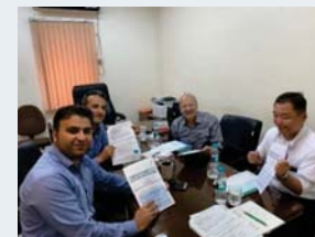
イランの石油化学会社と日本の技術専門家の協議の様子

適切な改善提案のためには、水銀の利用/排出状況の定量的な把握が必要になるため、分析・モニタリング能力の強化とともに実施していくことが重要になります。