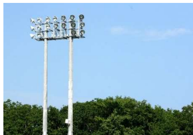
スポーツ施設の照明