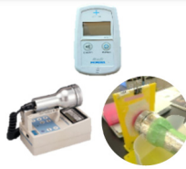
測定機器等の手配