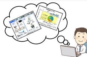
資料の作成・印刷