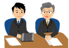
講師の選定・打ち合わせ