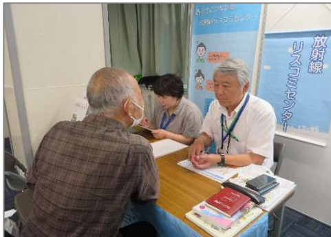
質問・相談の対応