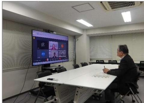
オンライン事前学習会の開催