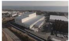
大熊町の仮設焼却施設(2017年12月)

対策地域内廃棄物処理計画（2013年12月26日一部改定）に基づき、災害廃棄物等の処理を実施中。