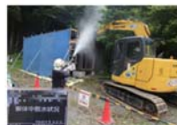
被災家屋等の解体の様子