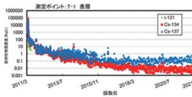
福島沿岸の海水の放射性物質濃度の推移