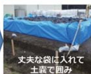
丈夫な袋に入れて 土嚢で囲み