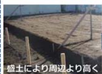
盛土により周辺より高く