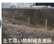
土で覆い放射線を遮蔽