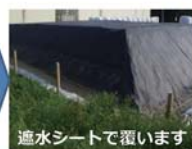
遮水シートで覆います