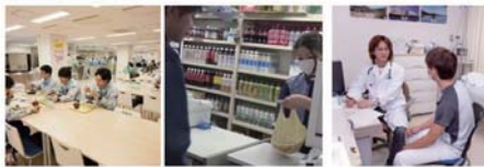
大型休憩所では、食堂やコンビニを整備