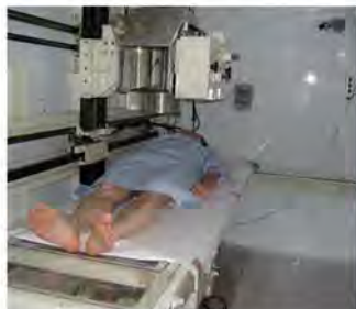
ホールボディ・カウンタ