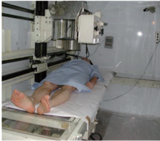
ホールボディ・カウンタ