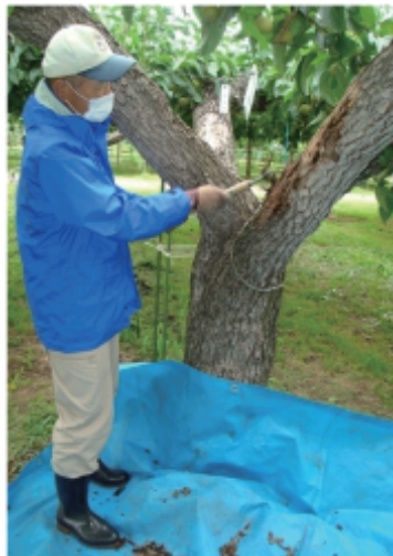
ナシの主枝の処理と放射線量