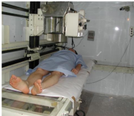
ホールボディ・カウンタ