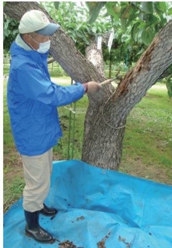
ナシの主枝の処理と放射線量