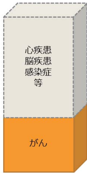
ヒトのがんの原因と関連のある因子