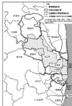
2020年3月時点 (帰還困難区域を除く全ての避難指示解除準備区域と居住制限区域の避難指示の解除)