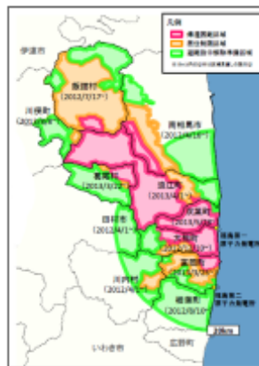
2013年8月時点 (区域の見直しが完了した時点)