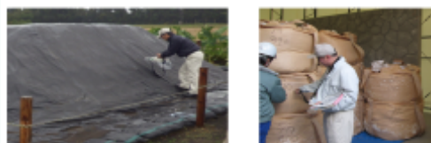
地方環境事務所による保管状況の確認の様子

一時保管場所において保管状況の確認を行い、指定廃棄物が特措法で定める基準等に従って適正に保管されているか確認。