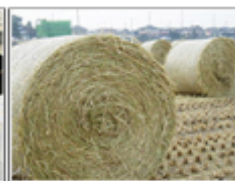
農林業系副産物(稲わら)