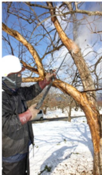
柿の高圧洗浄作業