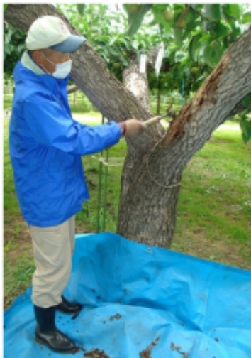
ナシの粗皮削り作業