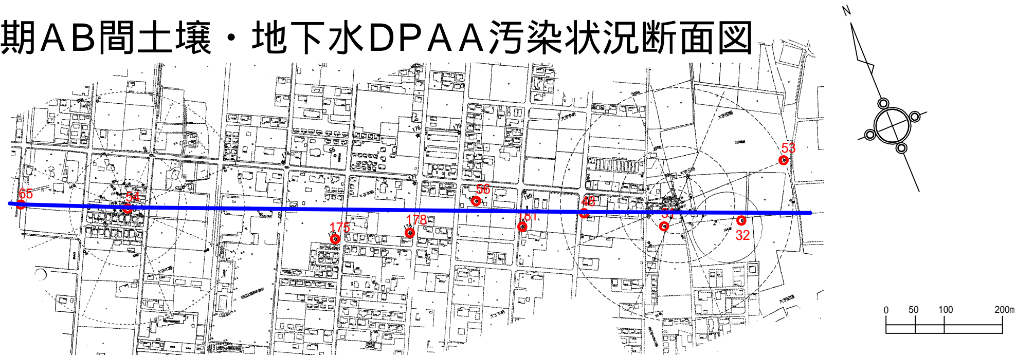
図5.2.1 初期AB間土壌・地下水DPAA汚染状況断面図