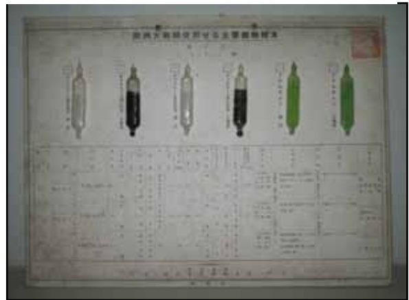
クシャミ剤のアンプル様容器6本(ジフェニル塩化砒素・ジフェニル青化砒素)が貼られた台紙の写真