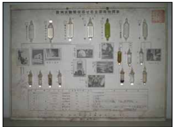
平時用途と毒ガスの関係が記されているアンプル様容器17本が貼られた台紙の写真