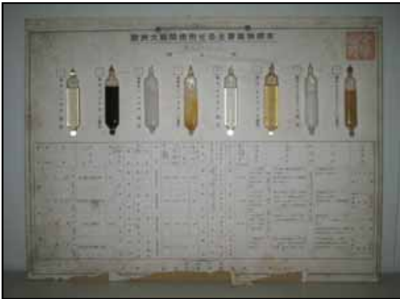
催涙剤のアンプル様容器8本(臭化ベンジル・塩化ピクリン・塩化アセトフェノン)が貼られた台紙の写真