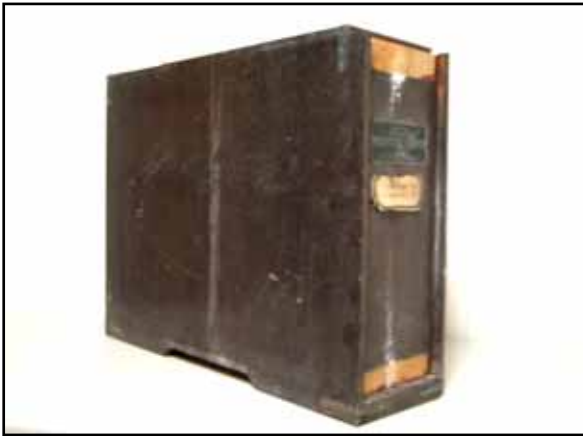
擬剤を収納した箱の全体の写真