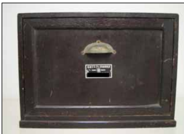
擬剤を収納した箱の全体の写真