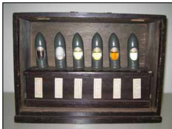
箱の蓋を開けた状態の写真