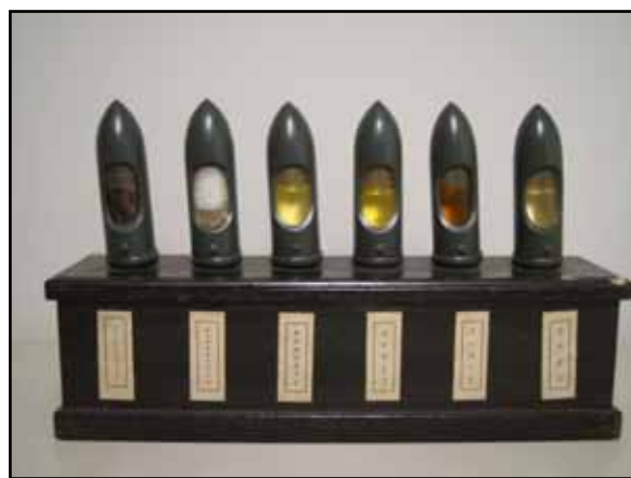
内部の砲弾様の形状をした容器の写真