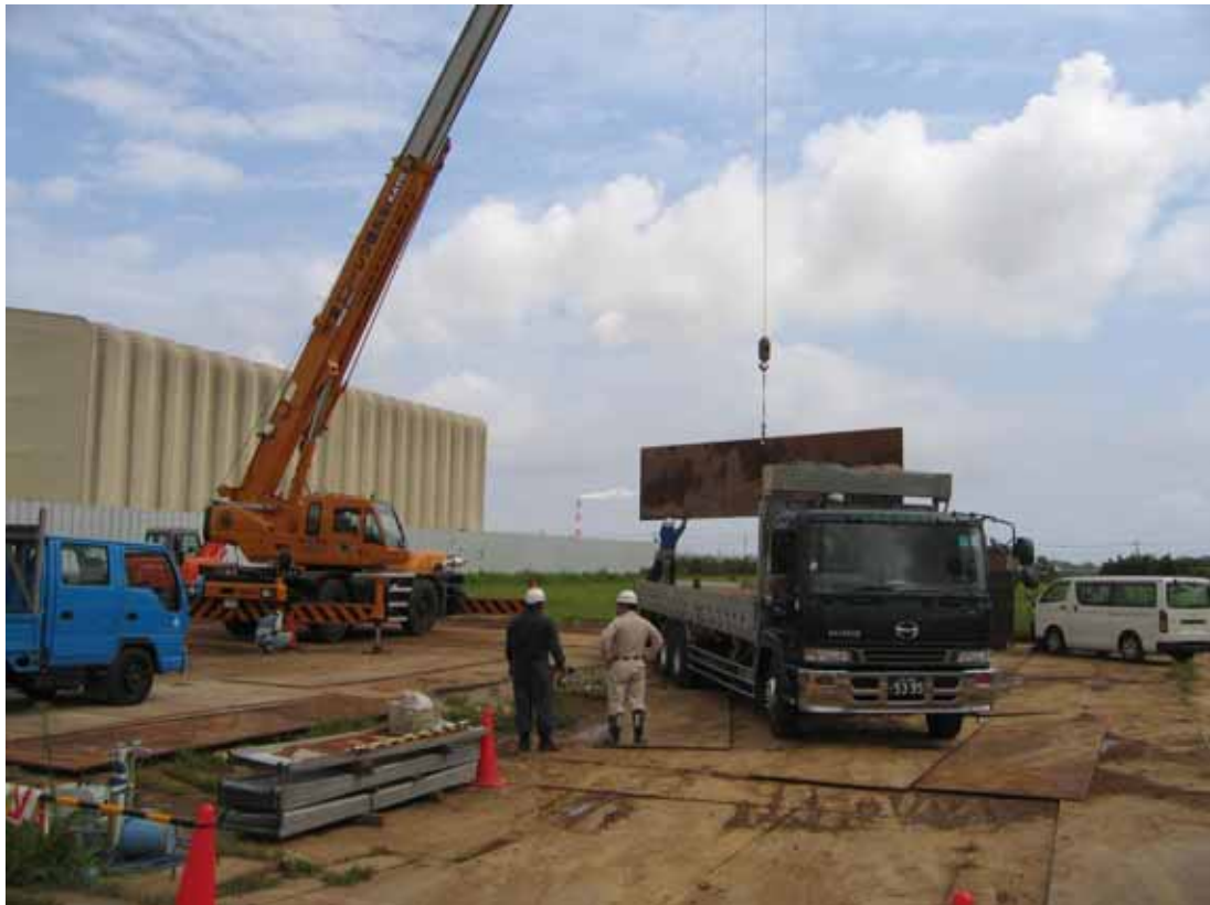
仮設資材の撤去作業

残りの作業についても、安全対策、環境対策に万全を講じて進めてまいりますので、引き続き御協力の程宜しくお願い致します。