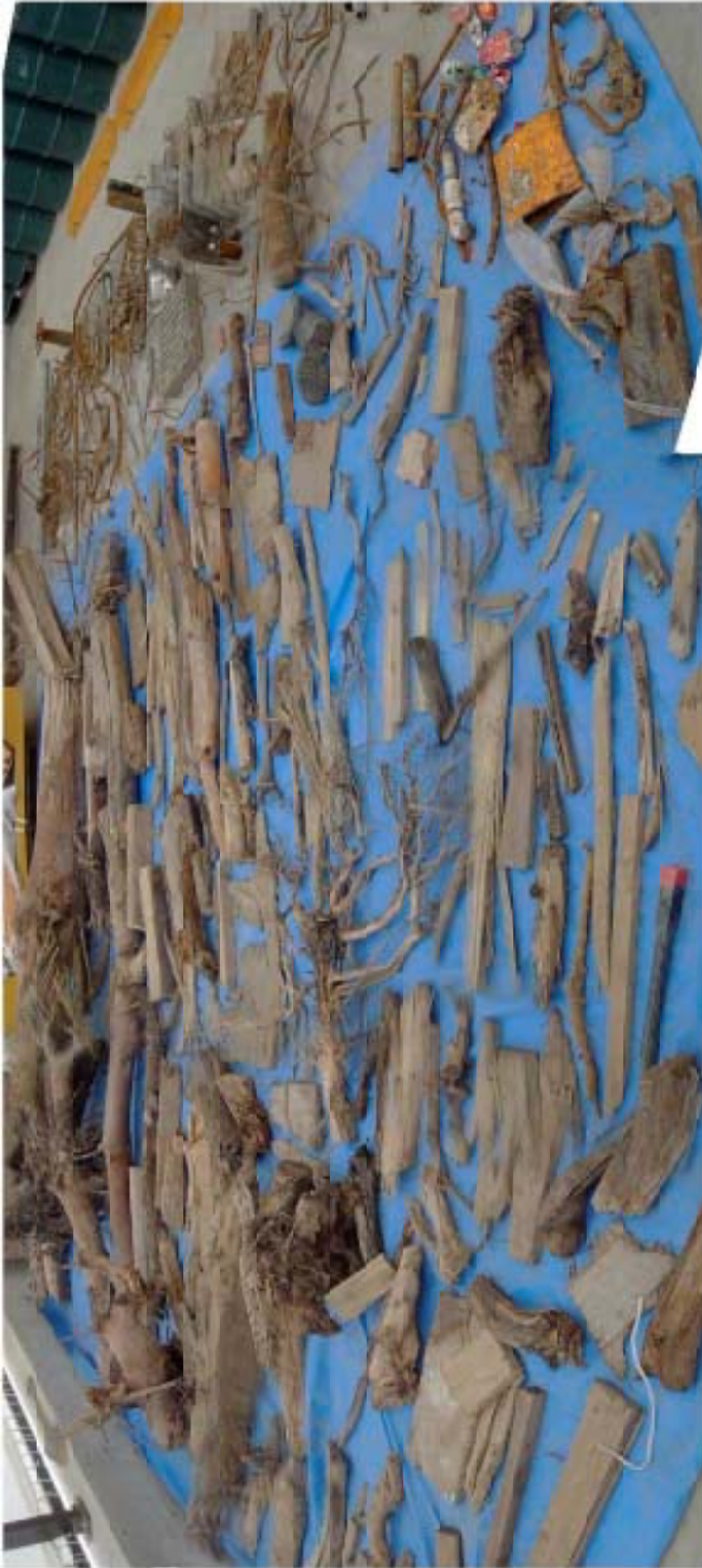
図10 掘削時に発見された廃棄物（木くず、金属片等）