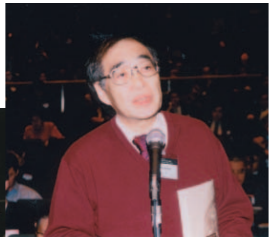
質疑応答風景 Questions from the audience