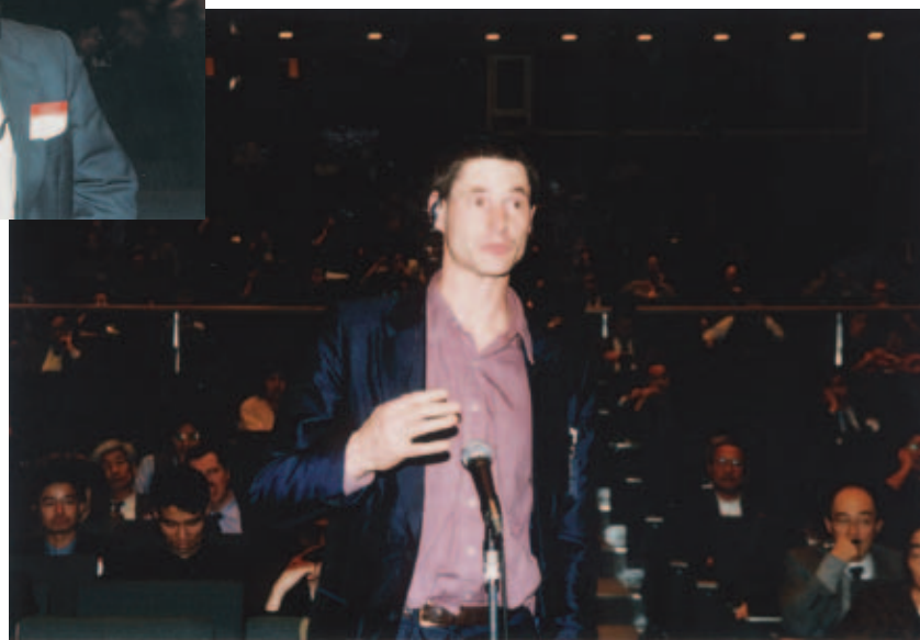
質疑応答風景 Questions from the audience