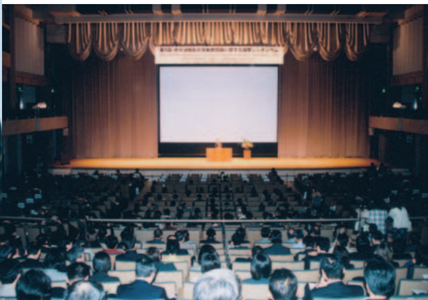
会場風景 In the assembly hall