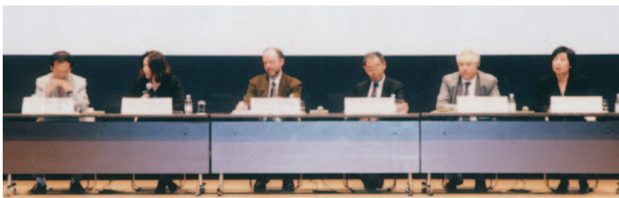
ディスカッション風景 Discussion Scene