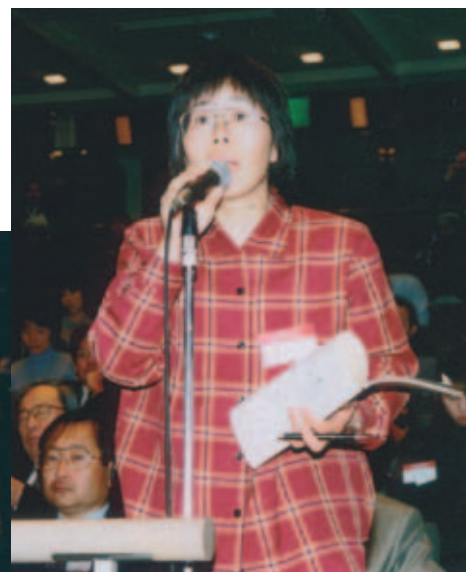
質疑応答風景 Questions from the audience