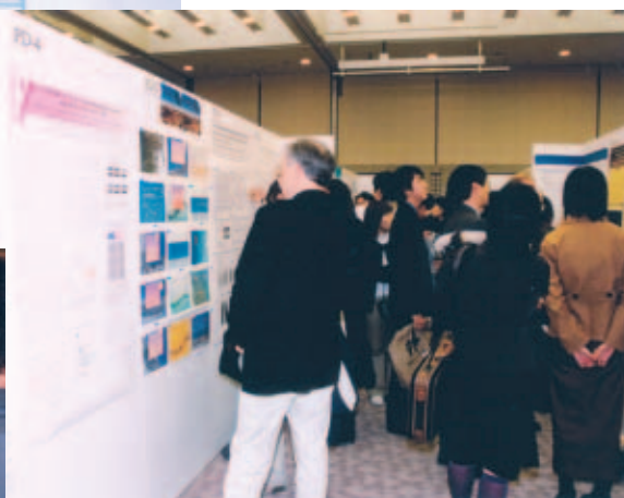
ポスターセッション Poster Session