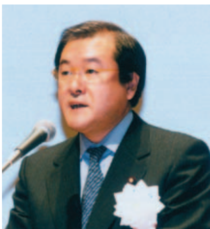
鈴木 俊一 環境大臣 Shunichi SUZUKI Minister of the Environment