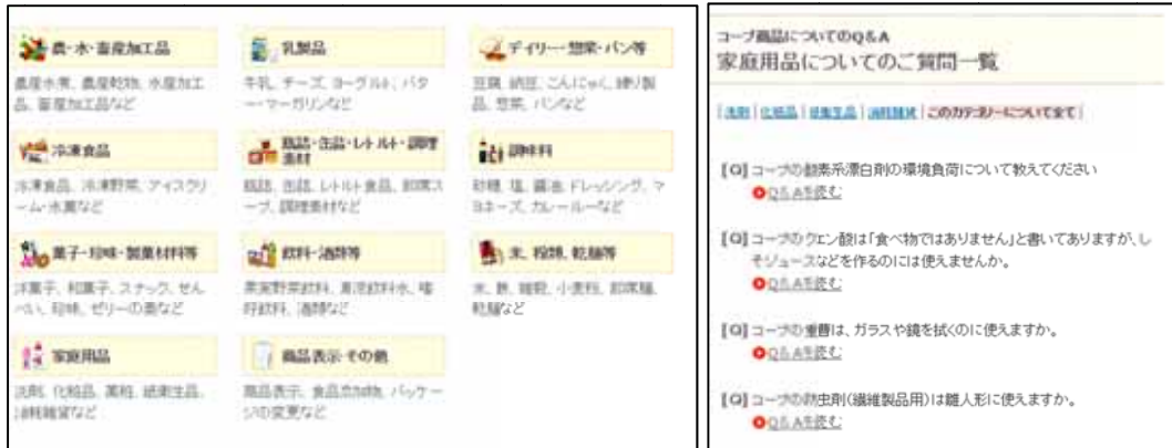
図表 2 ビスフェノール A 問題についての Q&A

コープ商品についての消費者・組合員からよくある質問に答える形式で情報提供をしている。また、消費者の目線に立って、商品の分類ごとに Q&A が整理されているほか、「この時期によくあるご質問」や「よく見られているご質問」といったコーナーも設けられており、消費者が欲しい情報を見つけやすいよう工夫されている。例えば、家庭用品の項目を選択すると、防虫剤の用途や酸素系漂白剤の環境影響等に関する Q&A が掲載されている。