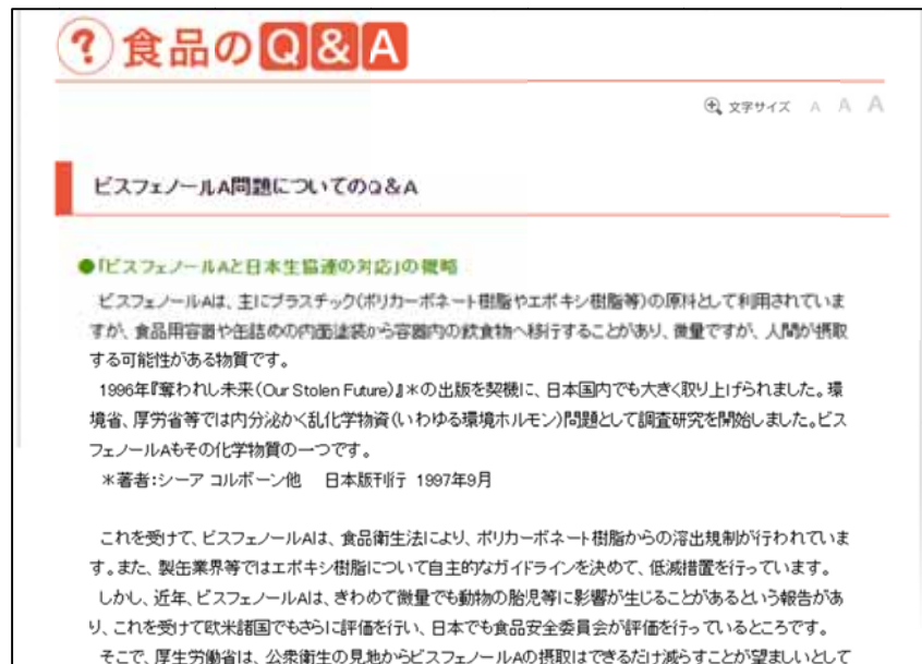
図表 1 ビスフェノール A 問題についての Q&A

食品や食品添加物、容器等に含まれる化学物質等について、テーマ・問題ごとに整理をして情報提供を行っている。物質の用途、ばく露経路、安全性、社会的に注目された背景や経緯、法規制の状況、消費者が気をつけるべきポイント等について、専門知識のない人でも分かるように平易な表現で解説されている。