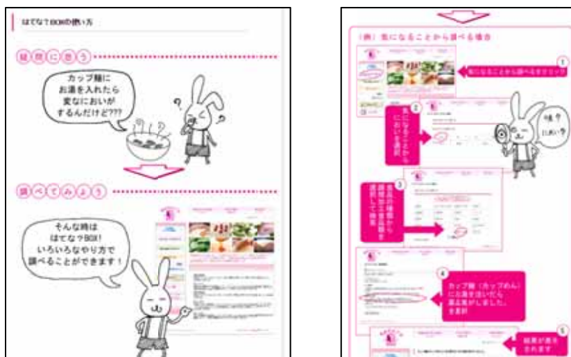
図表 3 「食品のはてな?BOX」の使い方

食品についてのコミュニケーションのページであり、消費者・組合員からよくある質問に答える形式で情報提供をしている。また、消費者の目線に立って、「気になること」(例：農薬、表示、使い方等)や「食品の種類」からも調べることが可能なように設計されており、消費者が自ら理解を深めることができるよう工夫されている。