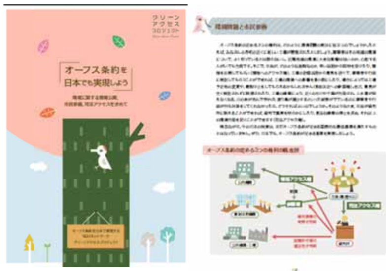
図表 1 オーフス条約に関するパンフレット