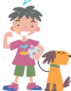
たろうくん ドリブル