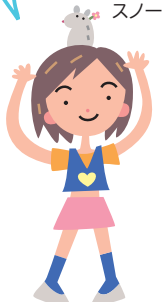
さくらさん スノー