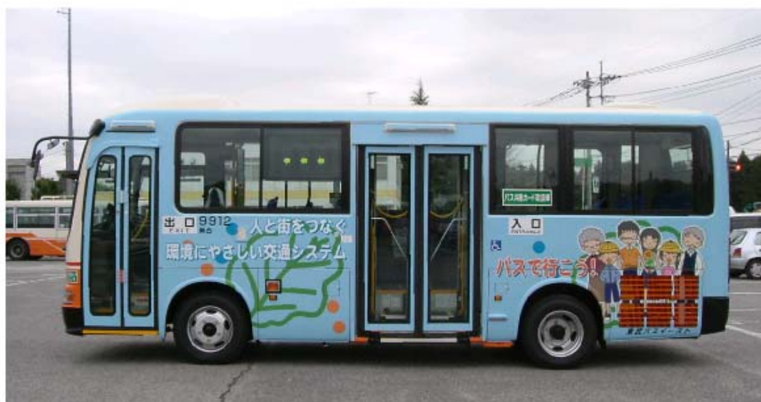
柏市 9912 番 助手席側