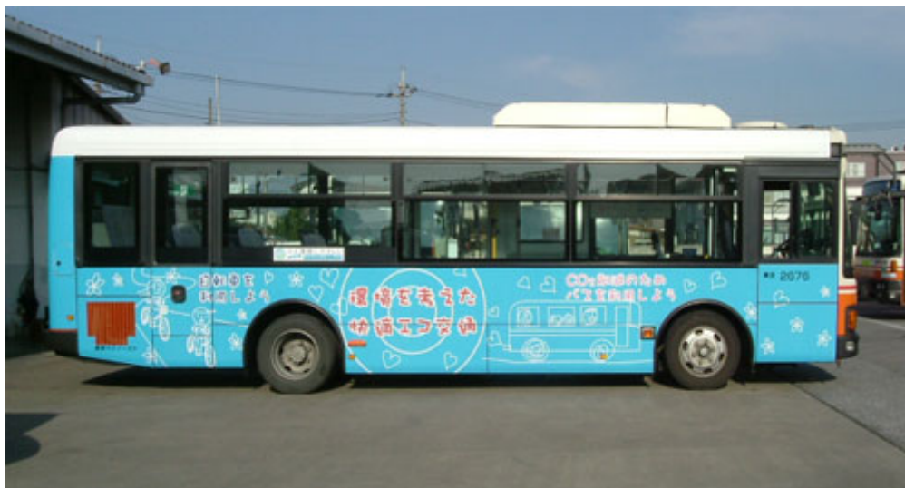
流山市 2676 番運転席側