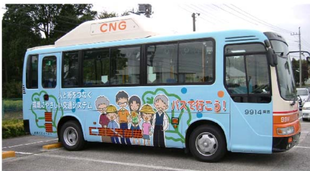
柏市 9914 番 (CNG 車輦) 運転席側