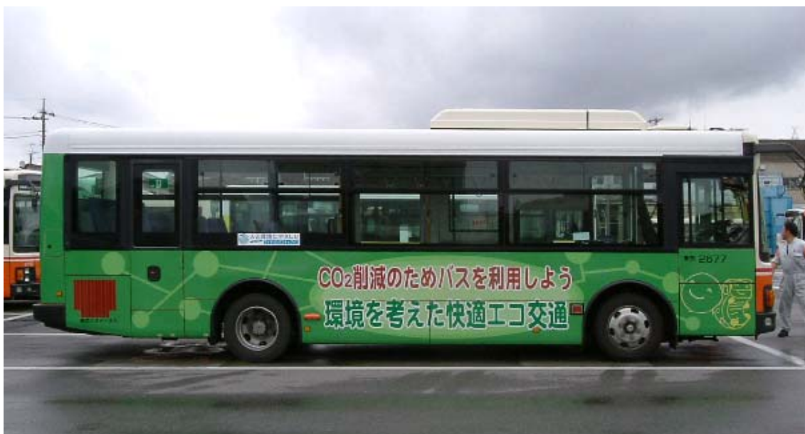
流山市 2677 番運転席側