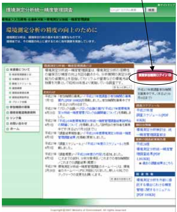
図 3-1.1 トップページ

・トップページ中の「 調査参加機関ログイン 」を選択するとログイン画面が表示されます。