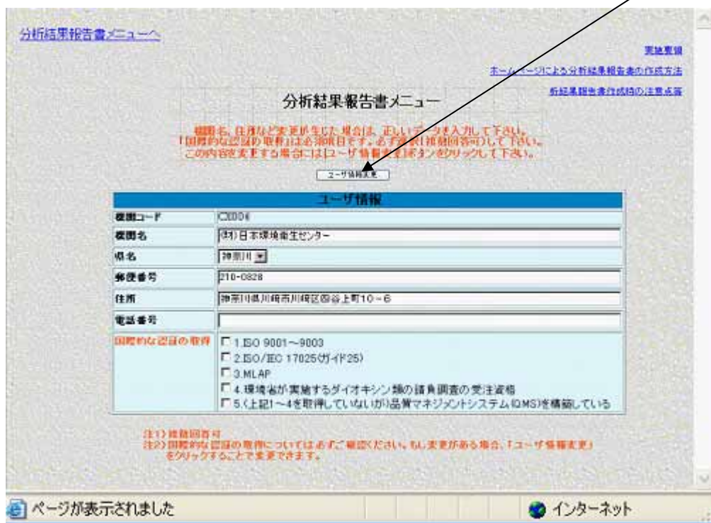
表 3-2.1 ユーザ情報

・ 3 - 1 でログインを行うと、分析結果報告書メニュー画面が表示されますので、ここで「ユーザ情報」を確認して下さい。変更等がある場合には、「ユーザ情報変更」ボタンをクリックして下さい。ユーザ情報変更画面が表示されます。正しいデータを入力し、「 ユーザ情報変更 」をクリックしますとユーザ情報変更確認画面表示後、分析結果報告書メニューへ戻ります。ただし、「機関コード」は変更できません。