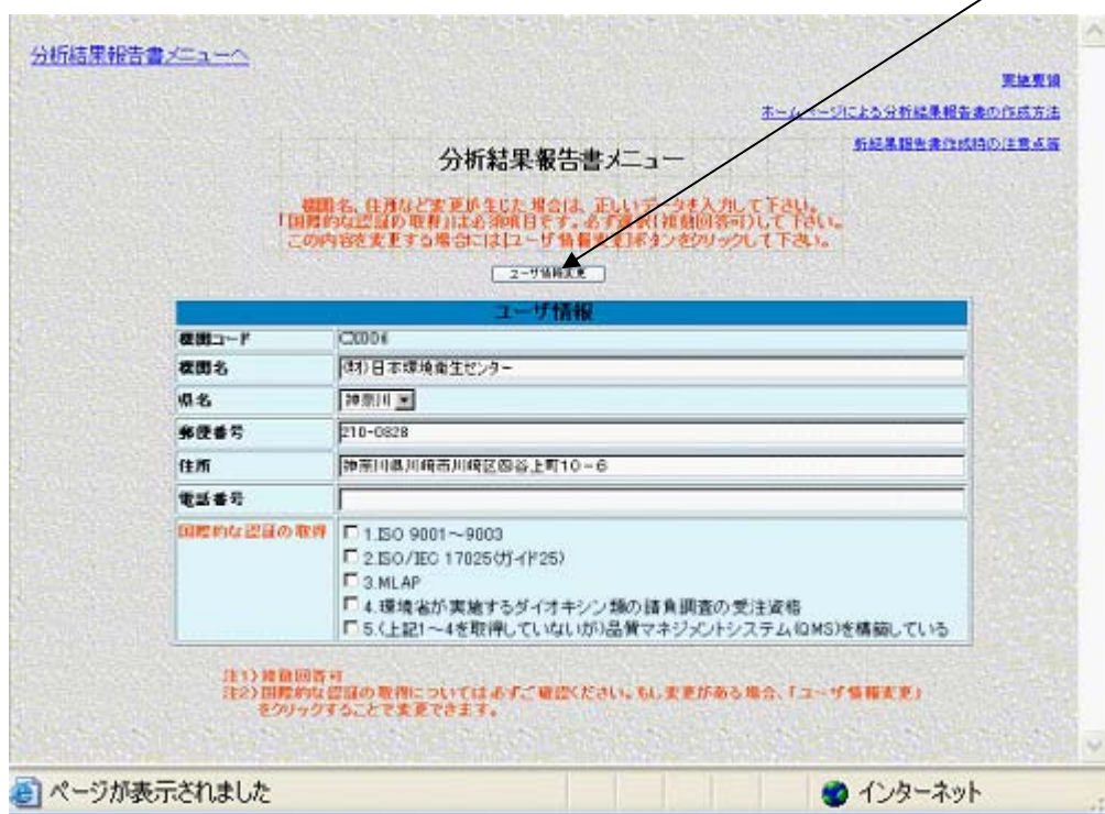
表 3-2.1 ユーザ情報

・3-1でログインを行うと、分析結果報告書メニュー画面が表示されますので、ここで「ユーザ情報」を確認して下さい。変更等がある場合には、「ユーザ情報変更」ボタンをクリックして下さい。ユーザ情報変更画面が表示されます。正しいデータを入力し、「 ユーザ情報変更 」をクリックしますとユーザ情報変更確認画面表示後、分析結果報告書メニューへ戻ります。ただし、「機関コード」は変更できません。