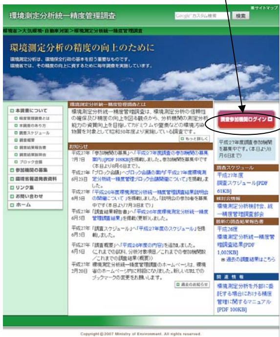
図 3-1.1 トップページ