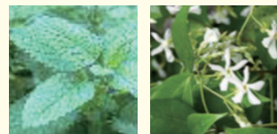
レモンバーム テイカズラ

ハーブ類による恒常的な香りを狙う緑化。ここではシトラス系 (レモン) の香りを中心に演出。また蚊刺され予防のためカレンソウを季節的な交換を前提に導入