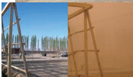
砂塵嵐発生前後の様子 (中国 タクラマカン砂漠南の策勒(チーラ))