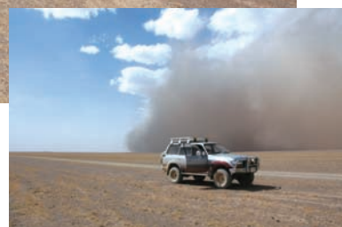
迫りくる砂塵嵐 (モンゴル マンダルゴビ南方)