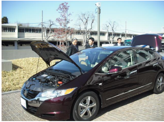
○県庁本庁舎における展示・試乗会 1月18日(月)