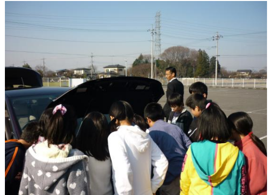
○大平町立大平南小学校での環境学習・体験乗車 1月21日(木)