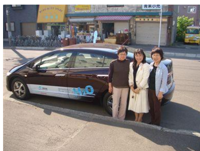
収録後の市民レポーターと番組パーソナリティ【中央】

収録日：平成21年6月18日（木）（→放送は翌日12:15～の15分間） 場所：市内一般公道 対象：公募市民（2名）及び番組パーソナリティ 番組名：FM G'sky 滝川市提供「みんなのたきかわ」