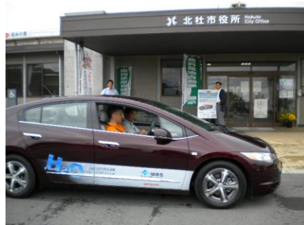
平成21年8月11日（火）長坂総合支所