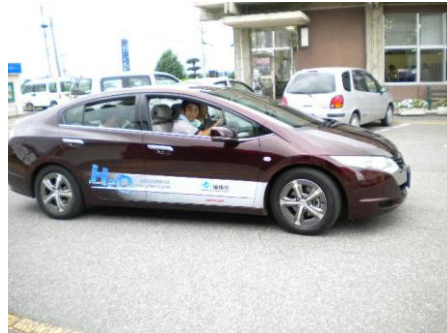
平成21年8月8日（土）JA梨北まつり