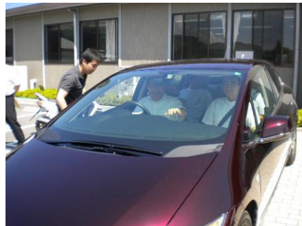
平成21年8月5日（水）高根総合支所