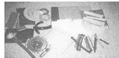
自動車ブレーキ部品