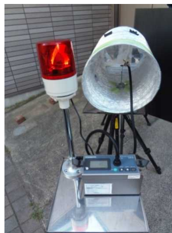
排気ダクト内の測 定時に警告灯を設 置した例