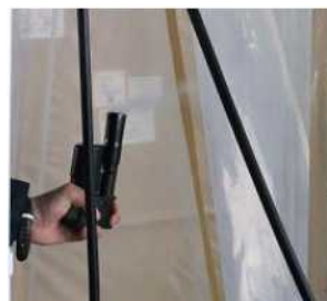
前室の入口の気流 方向の確認