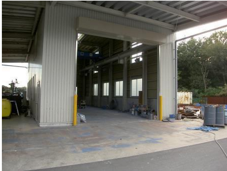
写真Ⅲ－6 除染ブースの例