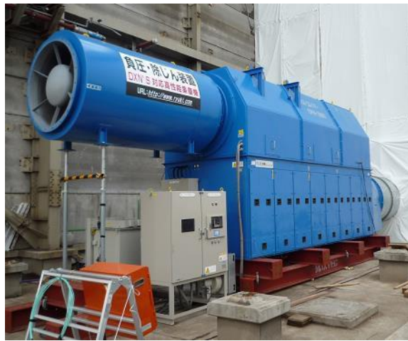
写真Ⅲ－1 大型集じん・排気装置の例（定格風量1,800m 3 /分）

大規模工事では隔離空間の大容量化が見込まれるため、大空間を負圧化する能力を有する集じん・排気装置が必要となる。また、煙突解体時にウォータージェット工法で断熱材を除去する場合、隔離空間内部の圧力が高くなり通常の計算による集じん・排気装置の設置台数では、負圧を確保できない状況となるおそれがある。これらの場合は、大型集じん・排気装置として大きな動力（200V/400V）で稼働するもの、且つ、フィルタ通気圧力損失やダクト抵抗による風量低下を考慮し定格全圧が2～3kPa程度のものを使用すること。