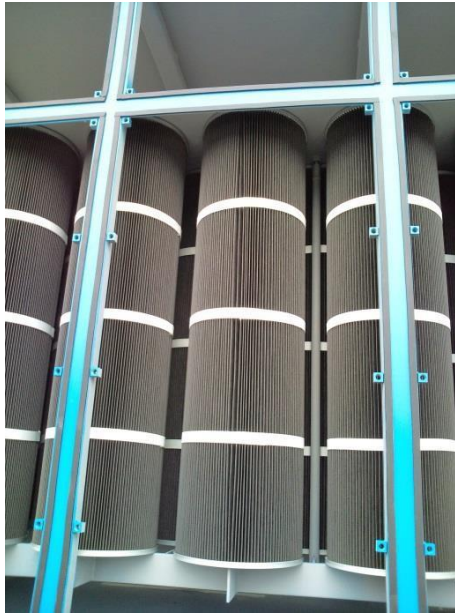
写真Ⅲ-2 プリーツ成形フィルタの例