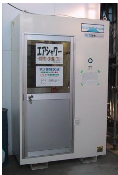
写真Ⅲ-4 エアシャワールーム(2重扉)の例

大規模工事では屋外にセキュリティゾーンを設けることが多いため、吹込み、吹き戻しによる石綿の外部への漏えいが起こらないよう、セキュリティゾーンと隔離空間を2重扉型のエアシャワールーム等で遮断し、隔離空間内の負圧(-20~-40Pa程度)を安定的に確保すること。また、作業員の入退出の多い現場では入退出時に渋滞を引き起こさないようエアシャワーは作業人数に応じ複数台設置すること。