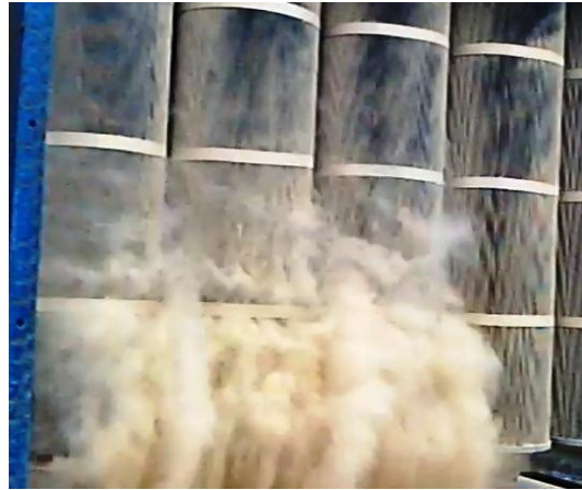
写真Ⅲ-3 フィルタ自動再生状況