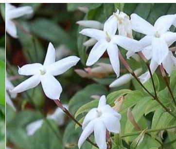
ハゴロモジャスミン