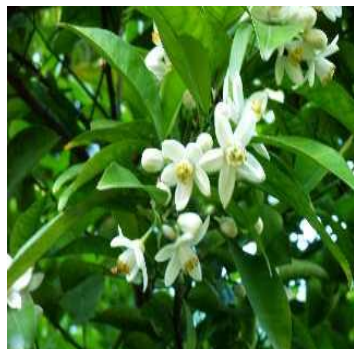
グレープフルーツ