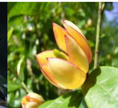
カラタネオガタマ