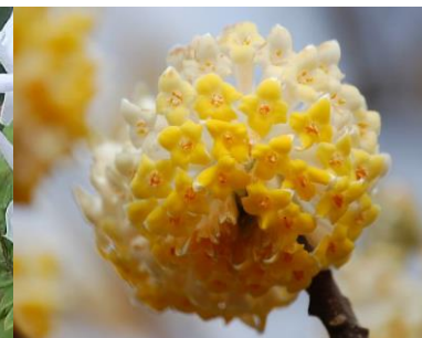
タイリンミツマタ