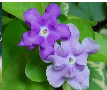
ニオイバンマツリ