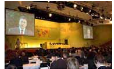
10月に愛知県名古屋市で生物多様性条約第10回締約国会議(COP10)開催