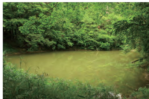
カワバタモロコがすむため池