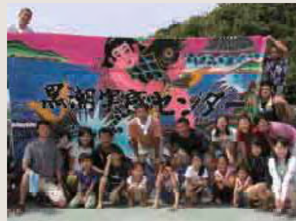
黒潮実感センター

エコツーリズムを実践する地域や事業者の優れた取り組み例を「エコツーリズム大賞」として表彰しています。受賞者の取り組みは、エコツーリズムの具体的な目標像を考える上で大いに参考となります。