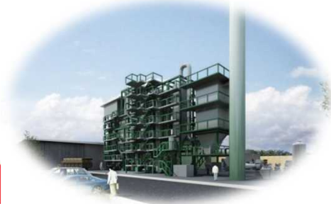
(参考) ミャンマー国における廃棄物発電事業の例