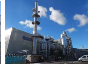
檜葉町の仮設焼却施設 (平成28年12月)