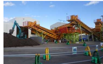
檜葉町の仮置場内破碎選別設備 (平成28年11月)