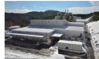
飯舘村蔭平地区 仮設焼却施設 (平成28年1月)

● 仮設焼却施設 (建設工事中を含む) □ 汚染廃棄物対策地域 ■ 避難指示解除準備区域 ■ 居住制限区域 ■ 帰還困難区域